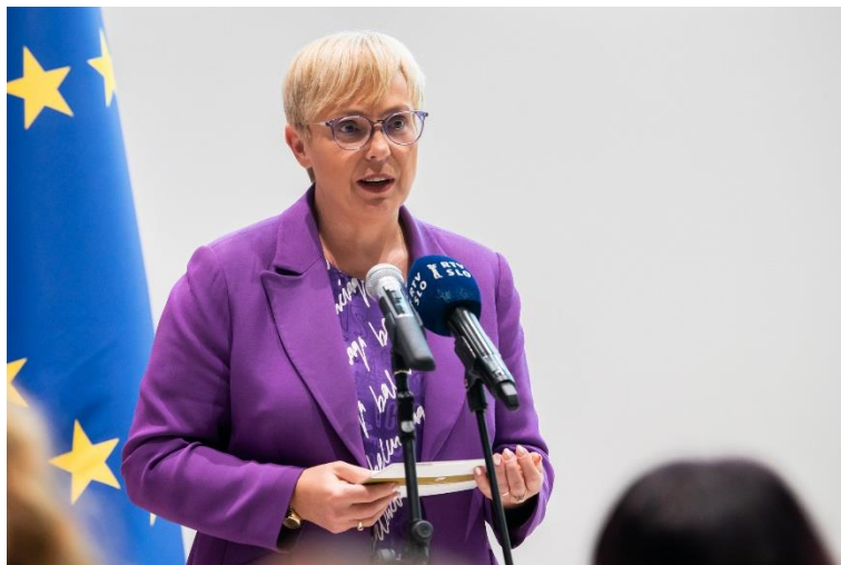
Slika 9: Predsednica Republike Slovenije, doktorica Nataša Pirc Musar

Predsednica Republike Slovenije, doktorica Nataša Pirc Musar je mlade inovativne kmete zavzeto nagovorila: »Prepričana sem, da kmetijstvo ni zaviralec sprememb, temveč ključni akter napredka in blaginje družbe, zato verjamem v vodilno vlogo kmetov in kmetic pri spremembah na bolje, iskanju trajnostnih rešitev in prilagoditev na posledice podnebnih sprememb. Te so čedalje bolj krute in vidno vplivajo na kakovost našega življenja in hrane.«