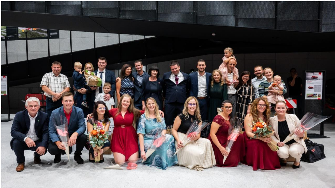
Slika 15: Kandidati za IMK 2023 s svojimi družinami in ekipo IMK 2023

Triglav, RTV SLO - Regionalni center Maribor, GPZ, Gorenc, Gen skupina, Ino Brežice, ProFarm, Mlekarna Celeia, Agrobiznis, Kmečka zadruga Sevnica, Gospodarsko Razstavišče, Vitli Krpan, Ekološka kmetija Kastelic, Kmetija Ostanek, Kmetija Janežič, Kmetija Duša in Kmetija Zakrajšek, Ministrstvo za kmetijstvo, gozdarstvo in prehrano ter Mreža za podeželje – od srca hvala.