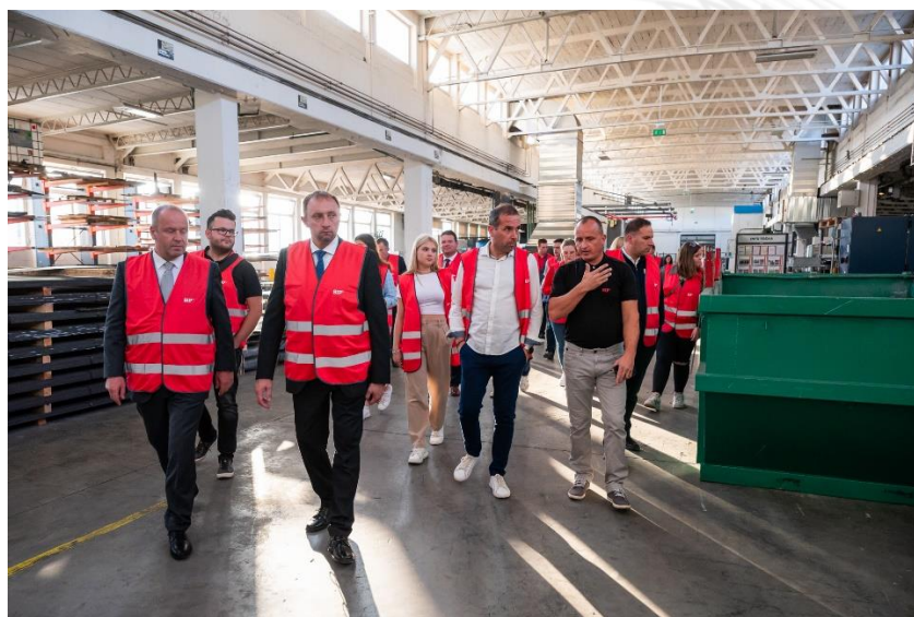
Slika 3: Pred začetkom osrednjega dela dogodka je sledil še VIP ogled proizvodnje podjetja SIP

Osrednji del dogodka je bila s pričetkom ob 18.30h ravno razglasitev zmagovalca izmed šestih izjemnih kandidatov, ki so se potegovali za ta častni naziv. Le-tega je na vrhuncu prireditve podelila predsednica Republike Slovenije, doktorica Nataša Pirc Musar , častna pokroviteljica dogodka.